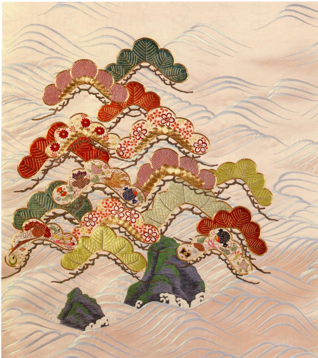
「袋帯 蓬萊山」 / 共同制作 女子美術大学工芸研究室 刺繡 所蔵