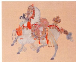
「東大寺唐鞍」刺繡/共同制作 女子美術大学工芸研究室 刺繡 所蔵