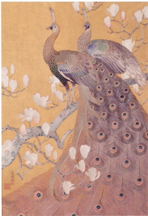
「刺繡孔雀図衝立」/共同制作 女子美術大学工芸研究室 刺繡 所蔵