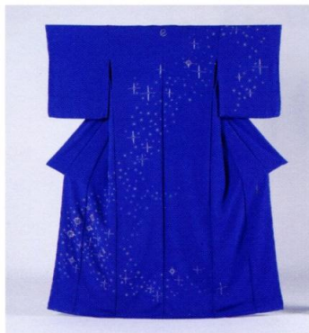
刺繡訪問着「わたしのおほしさま」/小嶋やまめ