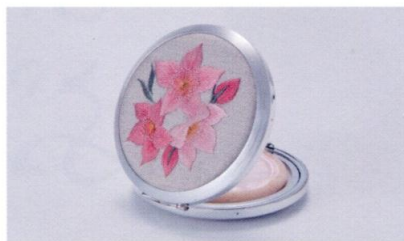
「コンパクト」/女子美術大学工芸研究室 刺繡 所蔵