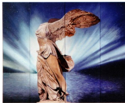
屏風「ニケ」/李張鳳 女子美術大学歴史資料室 所蔵