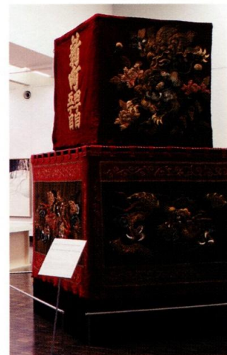
「刺繡上幕 緋羅紗地唐獅子牡丹模様」 「刺繡下幕 緋羅紗地雲龍唐草模様」 /NPO法人赤坂氷川山車保存会 所蔵