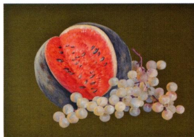
刺繡額「スイカとぶどう」/作者不明・女子美術大学工芸研究室 刺繡 所蔵