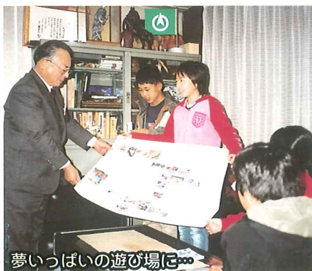
夢いっぱい遊び場に

平成14年に旧土佐山田町の小学校児童を代表とした「子どもの広場整備構想検討委員会」により「夢いっぱい遊び場に・・・」との思いを基に遊具の選定がおこなわれ施設整備が進められました。