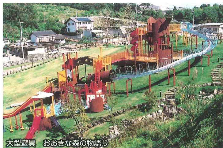
大型遊具 おおきな森の物語り