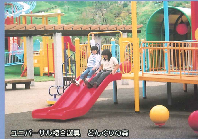
ユニバーサル複合遊具 どんぐりの森