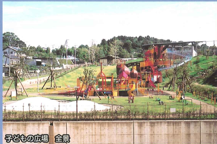
子どもの広場 全景