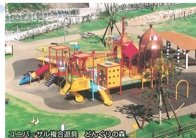
ユニバーサル複合遊具 どんぐりの森