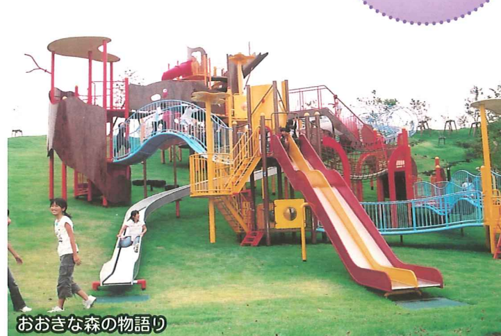
おおきな森の物語り