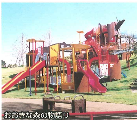
おおきな森の物語り