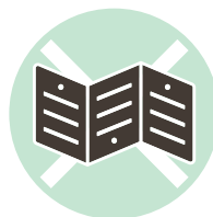
粘着剤がついた紙