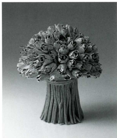
チューリップのブーケ 37×34×32cm