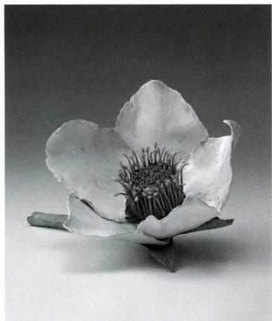
クリスマスローズ 27×45×31cm