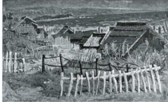
「冬の海邊(和食の浜)」 油彩