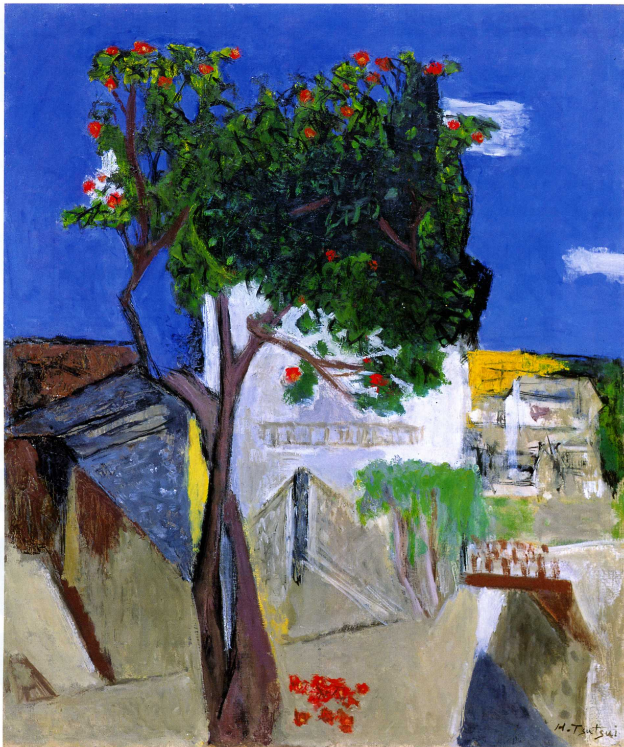
「椿の木のある風景」 油彩