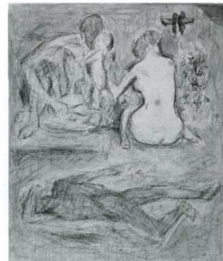
「浜ひるがおの家族」 鉛筆、水彩