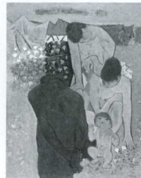
「老人と若い家族」 油彩