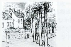
「ケルシーの詩」 リトグラフ