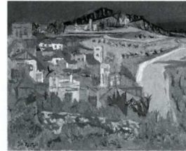
「タナゴラの風景」 油彩