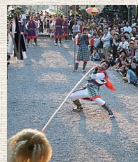
▲おなばれの見せ場！