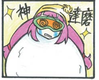
(山田高校マンガ部)