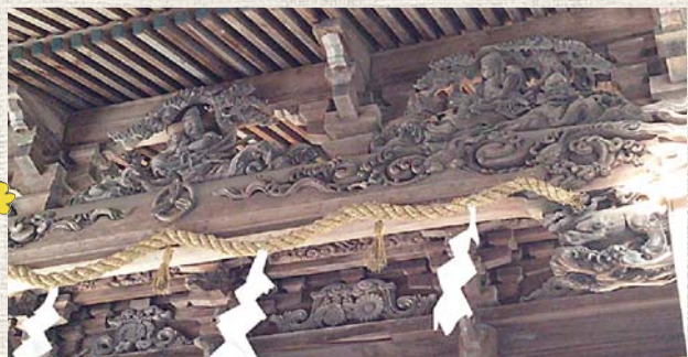
▲土佐随一の誉れ高い彫刻