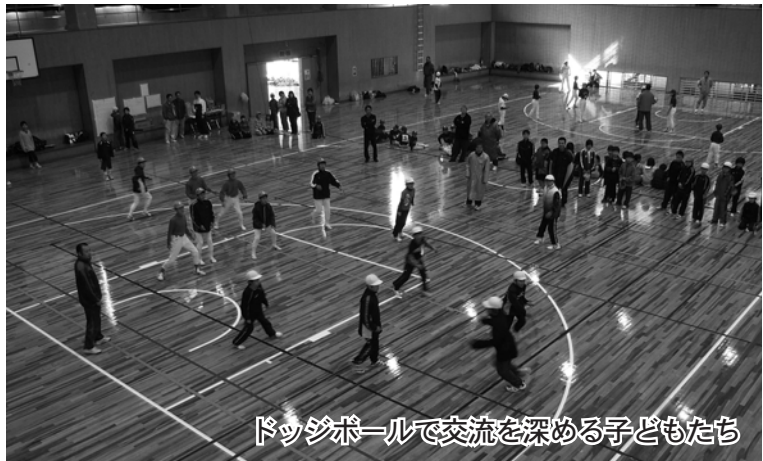
ドッジボールで交流を深める子どもたち

2月13日、香北体育センターで『第4回香美市少年スポーツ交流大会』が開催され、市内のスポーツ少年団など9団体・12チームが参加しました。