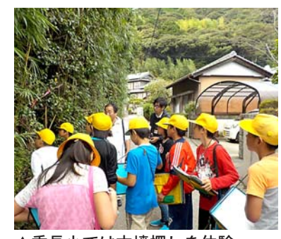
▲香長小では古墳探しを体験

本調査では、学力と共に、子どもたちの生活や意識の状況も調査しています。香美市では、下のグラフに示したような、将来の生き方につながる項目に着目しています。 本年度、小学校は全国平均以上の結果となりました。自信を持ち、いきいきと学習や生活に取り組む小学生の姿が見えるようです。校内の学習だけでなく、地域でたくさんの方に出会い、影響を受けることで、これらの項目に伸びが見られたと考えられます。