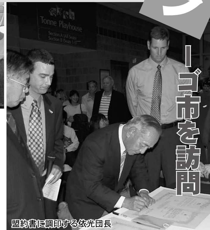
盟約書に調印する依光団長

香美市の訪問は地元新聞紙にも大きく取り上げられた。写真はラーゴ警察訪問の際、白バイにまたがる山田高校の短期留学生。