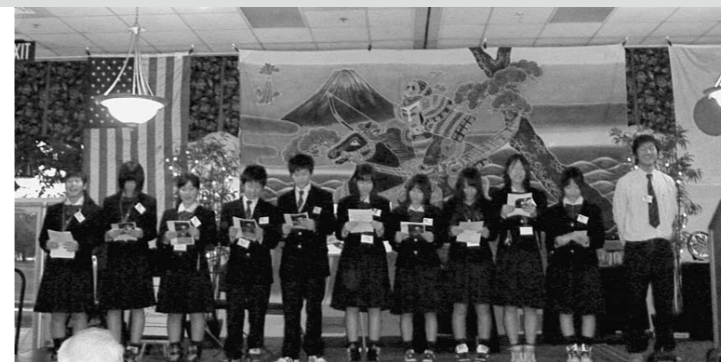
▲歓迎会で合唱する山田高校短期留学生