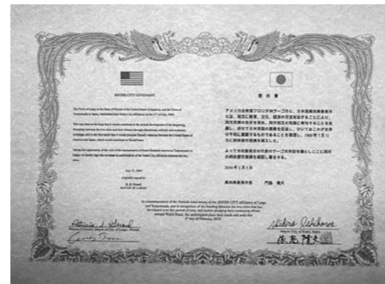
▲40周年を記念して交わされた盟約書「香美市の訪問を機とし、両市の姉妹都市提携を確認し署名する」とある。

その後、お互いに訪問を繰り返し、平成4年4月18日には、山田高校とラーゴ高校の姉妹校締結がされ、相互に短期留学がされるようになりました。香美市