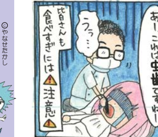
(山田高校マンガ部)