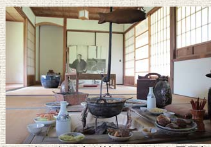
▲いまにも酒宴が始まりそうな雰囲気

梅雨の晴れ間、吉井勇記念館を訪れると、のどかな山間の風景に溶け込むかやぶきの庵が見えます。引き戸を開けると、まず目に入るのはおいしそうな料理の数々…の食品サンプル。イタドリ炒め物にぜんまいの煮物、ハチク、囲炉裏で焼いた川魚。高知で暮らす我々には、なじみの深い山里の料理が並んでいます。地元の人が勇のためによく差し入れ