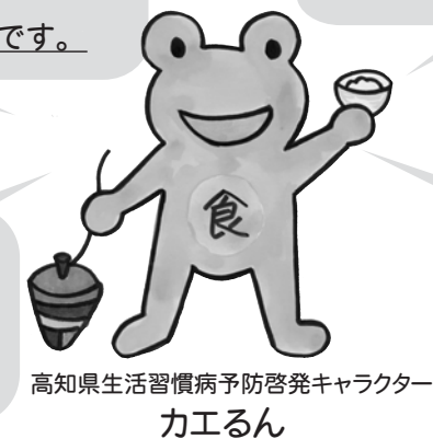
高知県生活習慣病予防啓発キャラクター カエるん

受診券に同封しています「特定健康診査希望調査票」の返信にご協力ください。なお、今年度75歳になられる方には、同封していません。