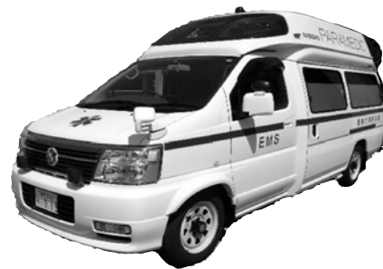
▲購入した高規格救急自動車