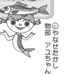
物部アユちゃん ©やなせたかし

「〇〇ダムよりお知らせします。間もなく放流を始めます。危険ですので川から出てください」内容は、ダムによって少し異なりますがほとんど同じ内容です。