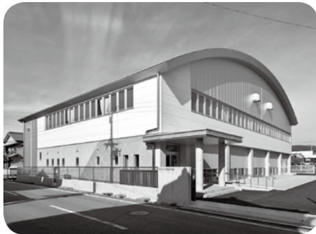
新しくなった宝町体育館