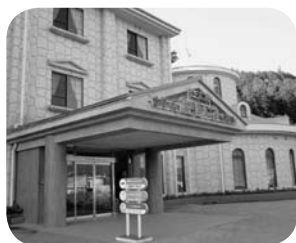
ピースフルセレネ

Q 消防費の中の被服費の予算が大幅増額となっているが。 A 増額は、防火服など装備一式を3年間計画で更新する。また、