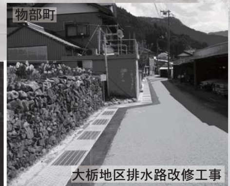
大栃地区排水路改修工事