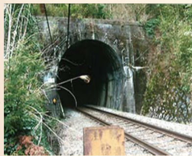
▲矢立(やたたず)トンネル

トンネルがあり、距離にして約6キロに及ぶ。全距離のおよそ4割である。総工費は531万円。1キロ当たりの単価は、全国平均20万円に対し、