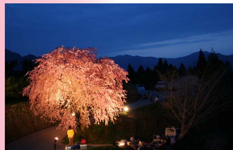
くもん農園のしだれ桜(物部町頓定) 京都平安神宮の「八重旭紅枝垂れ桜」。樹齢35年。満開に近づくとつれ、花びらが開き、重量感のある落ち着いた色合いの桜になります。