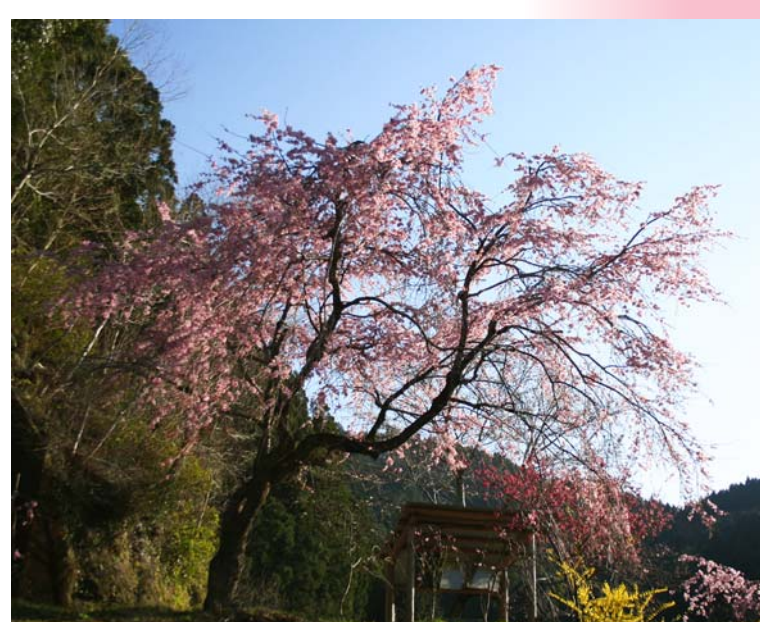
中谷川のしだれ桜(物部町中谷川) 物部森林ストックヤードから、臼杵トンネルまでの間にのぼり口があります。国道195号からも枝が見えています。