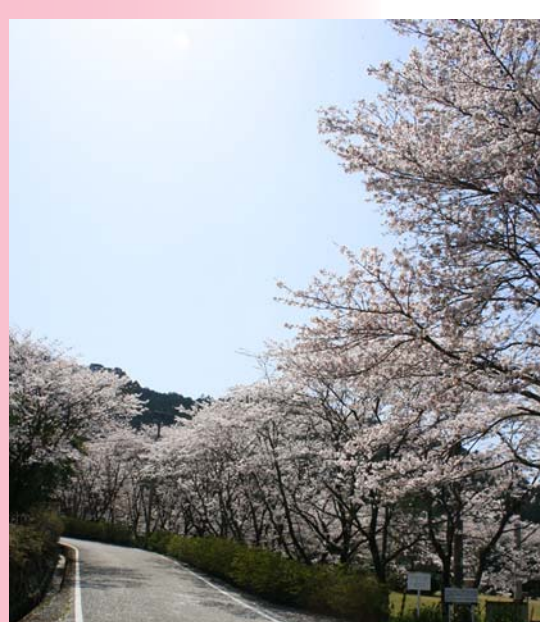
吉野青少年の家(香北町吉野)

☆今回掲載はできなかったのですが、杉田ダム周辺など、ほかにも見所があります。桜の季節にぜひ市内を散策ください。