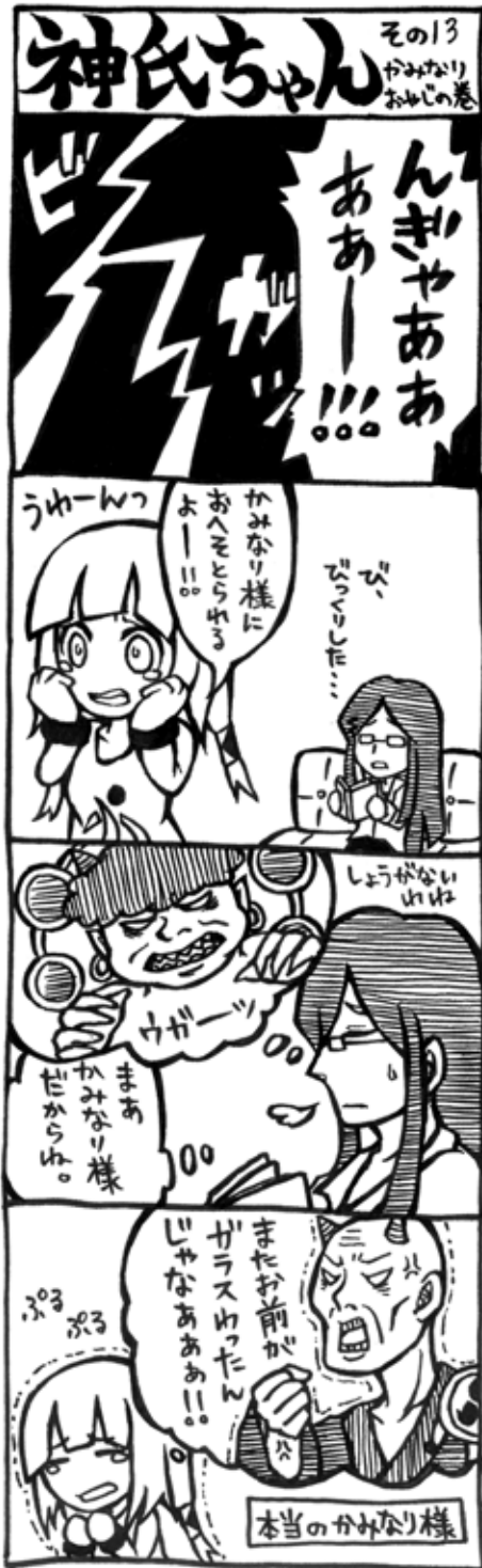
作:山崎業紀・宗石真奈 (山田高校マンガ部)