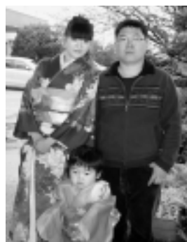
家族と一緒に (右がチンソリクさん)