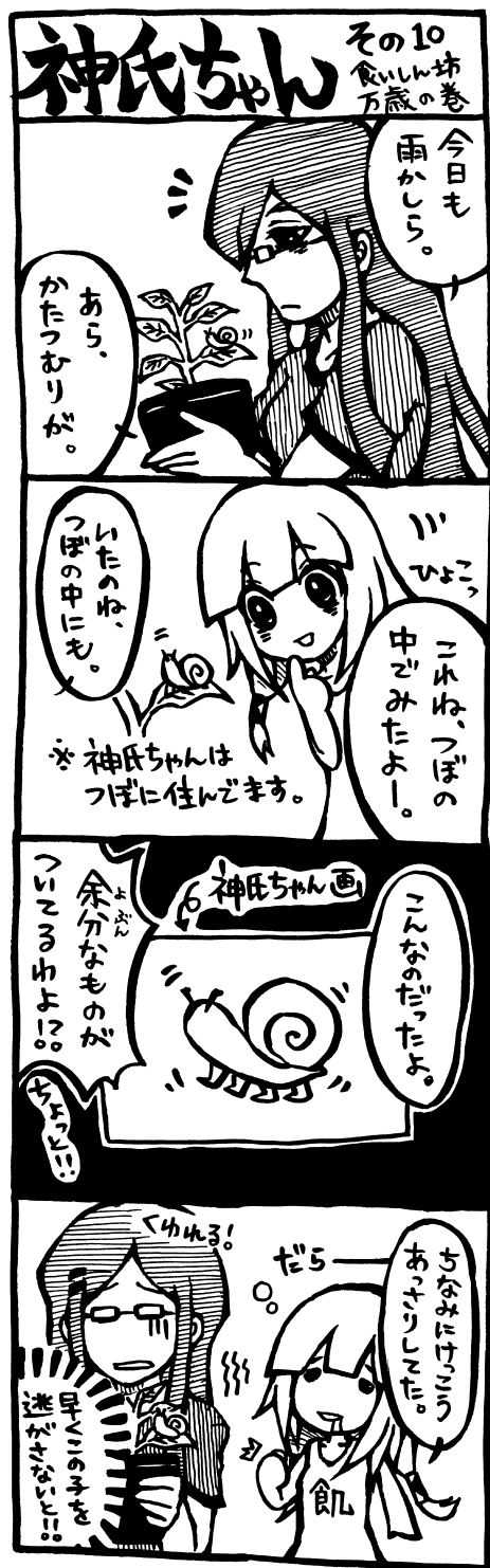
作：山關菜紀・宗石真奈 (山田高校マンガ部)