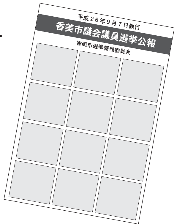
▲選挙公報イメージ