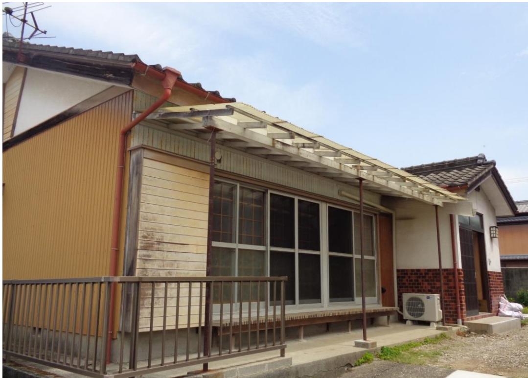
土佐山田町の市街地にあるコンパクトな平屋住宅。 2026年に耐震補強・居室全面リフォーム工事を実施。