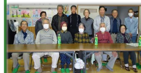
体操を無理せずやっています。芝桜の手入れなども。見に来てください。

㉛ ほきやまらぶらぶ会 ✿ 新改北部構造改善センター おおむね月1回 10時～ 香美はつらつ体操(ロング)