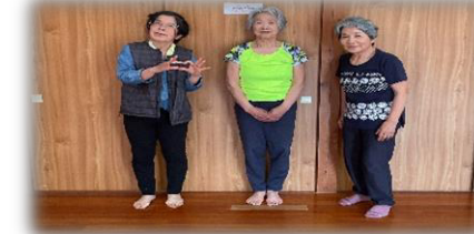
きついで長生きできるでー！ 長生きしたい方はどうぞ♡ どなたでも参加OK!!

⑮ サークルオレンジ ✿ 楠目地区老人憩いの家 毎週月曜日 13時30分～15:30 オリジナル体操・ストレッチ・筋トレ ※参加費 100円/回