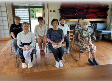
おしゃべりを中心に 元気に仲良く続けています。

㉓ 岩積いきいきクラブ ✿ 岩積公民館 第1・3木曜日 13時半～ 香美はつらつ体操 20分版