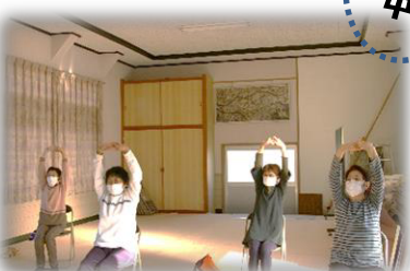
和気あいあいと楽しく集まって体操やおしゃべりをしています。

㉘ 須江にここにこ会 ✿ 須江公民館 毎週火曜・金曜日 13時半～ 香美はつらつ体操