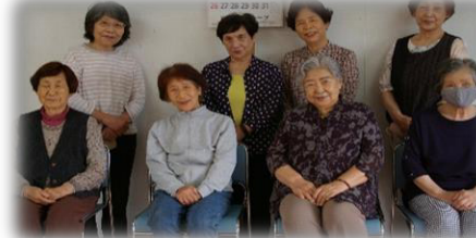
皆はつらつ、やる気マンマン！ 体操は1時間。卓球の「おしゃもじクラブ」は毎週土曜日にやっています。

㉕ 古町ハピネスクラブ ✿ 古町公民館 毎週木曜日 14時～ 香美はつらつ体操・365歩のマーチ ※地区外の方も参加OK!!