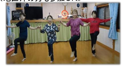
継続は力なり(H3年から開始) 皆が集まって体操する事で元気いっぱい。どなたでもご参加ください。

⑯ 楠目地区健康体操 ✿ 伏原公民館 毎週金曜日 19時～21時 健康体操 ※参加費 100円/回 ※地区外の方も参加OK!!