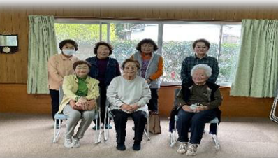
皆と会ってお話を 楽しくできるのが嬉しいです。

㉙ はつらつゆりの会 ✿ 久次公民館 毎週土曜日 10時～(7～9月休み) 香美はつらつ体操 ※地区外の方も参加OK!!