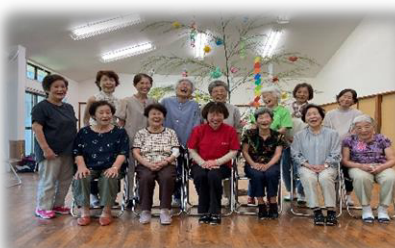
キラキラ輝くダイヤモンドのような 老若男女が集まっています

㉚ クラブだいあもんど ✿ 植公民館 毎月第1金曜日 10時～12時 ※地区外の方も参加OK!!