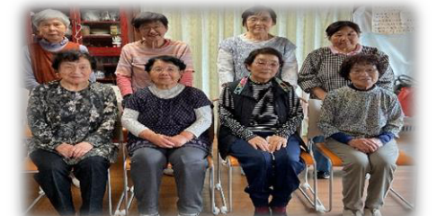
クラブ名は、松本大師堂前の大きなぎんなんの木から。皆、元気に掛け声をかけながら体操しています。

㉑ 松本ぎんなんクラブ ✿ 松本公民館 毎週火曜日 10時～ 香美はつらつ体操・茶話会