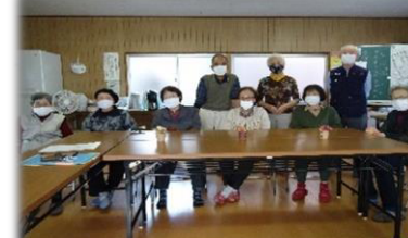
体操のほかレクリエーションも楽しくやっています。

⑱ 山田中部老人クラブ ★ 旭町中央集会所 第1木曜日 10時～12時 香美はつらつ体操・瀬戸の花嫁