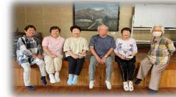
皆が集まって運動することで、元気いっぱい。楽しく運動しています。どなたでもご参加ください。

⑭ サークルさくら ✿ 楠目地区老人憩いの家 毎週木曜日 10時～ オリジナル体操・ストレッチ