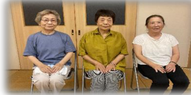
笑いが絶えず話は尽きません。皆やさしく、仲が良いです。歌や季節の行事も楽しめる会です。

⑫ 中組弥生会 ✿ お婉堂 毎月第1・3月曜日 10時～ 香美はつらつ体操 45分 ラジオ体操第1・2