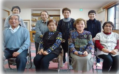
やさしく仲良くやっています

⑬ 秦山老人クラブ ★ 秦山ふれあいセンター 毎月第2木曜日 14時～16時 ※事業により時間変更あり 脳トレ・輪投げ大会・調理実習・研修会 ※上野・宗目地区の方のみ参加OK!!