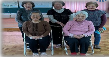
皆で和気あいあいと楽しんでいます。一緒に運動してみたい方、ぜひ参加してみませんか？新しい参加者大歓迎です。

⑰ 黒土はつらつ体操 ✿ 黒土集会所 毎週月曜日 10時～11時 香美はつらつ体操・瀬戸の花嫁