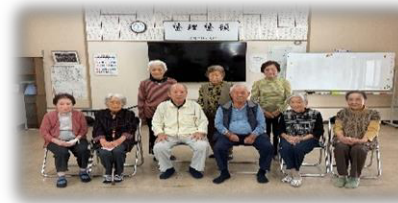
おしゃべりにも花が咲きます。 野外活動も楽しいです。

⑲ 東町中部いきいき教室 ✿ 東町中部公民館 毎週水・土曜日 10時～11時 香美はつらつ体操 ※参加費¥200/月