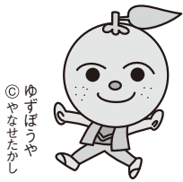
ゆずぼんや ©やなせたかし

Q 補助対象団体は。 A 取水のため水揚げポンプを使用している片地土地改良区、杉田ダム土地改良区、楠目土地改良区に対し電気料高騰分を補助するものである。