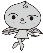
かりかりモチちゃん ©やなせたかし

A 低コスト耐候性ハウスを8棟整備する予定である。受益農業者数は6人、整備場所は土佐山田町で品目は二ラである。