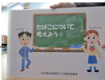
▲読み聞かせて使用している紙芝居

香美市の未成年の喫煙防止教育では、喫煙が心身に及ぼす影響などを正しく伝えるため、学校や健康づくり団体と協力し、小中学校での紙芝居の読み聞かせなどを行っています。