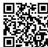
▲県内で対象の医療機関一覧