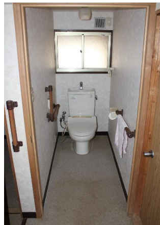
シャワー室 / トイレ