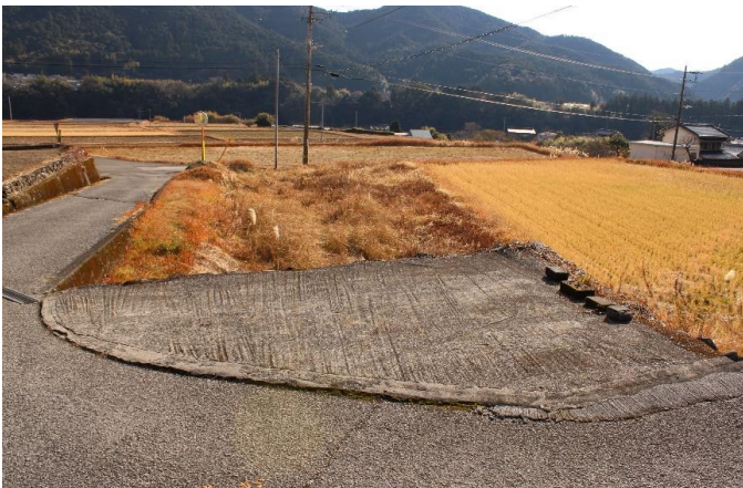
駐車場 と 南の田畑