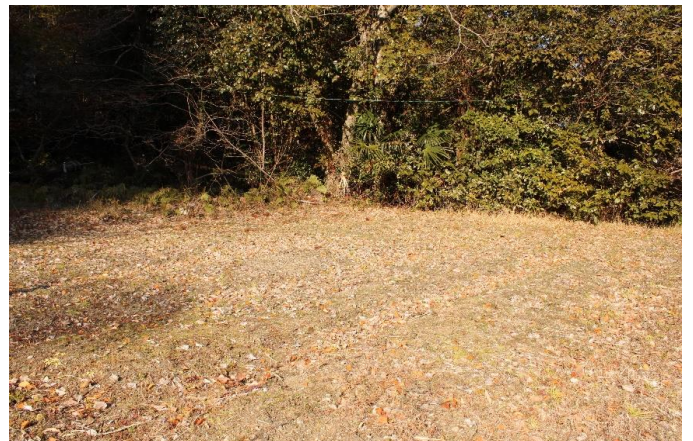
敷地外の畑 (果樹など)