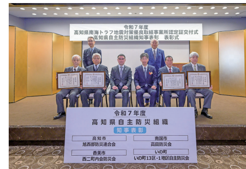
▲他の受賞防災会との集合写真

この表彰は、地域の自主防災活動で特に優れていると認められる団体を県が表彰することで、他の模範となる取組を広め、自主防災組織の結成や活動強化を図り、地域防災力向上を目指すものです。今回は、西二町内会防災会の「防災活動を地域全体に広めるとともにその対策を継続する仕組みの構築」「課題解決に向けた工夫ある取組」が評価され、受賞となりました。これらの活動は、市民一人ひとりが、日頃から防災意識を高め、地域で支え合うことの大切さを改めて教えてくれるものとなりました。西二町内会防災会の皆さんの素晴らしいご尽力に深く感謝するとともに、この取組が他の地域にも広がり、防災力向上に繋がることを心より期待いたします。