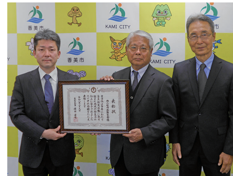
▲依光市長に受賞を報告