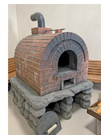
▲実際に撮影で使用されたパン窯