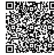
▲ホームページはこちら

市内在住の方で奨学金等の貸与を受けて大学等を修了し、就労中の方に奨学金の返還を支援します。 詳しくは、香美市ホームページをご確認ください。