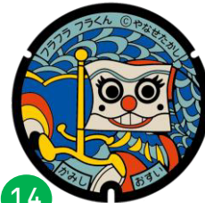
フラフラ フラくん

森の巨人たち百選に選ばれた香美市物部町の西熊さおりガ原にある巨木「イヌザクラ」、「トチノキ」がモチーフにしてデザインしています。森の案内人。森のことならなんでも知っていて、道に迷ったら必ず助けてくれる。