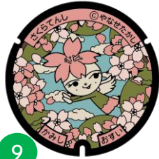
さくらてんし ※マンホールカードあり

香美市香北町の特産品である甘くておいしいカタイ桃「かりかり桃子」をモチーフにしてデザインしています。ちょっとカタイところもあるけれど、とってまじめな女の子。