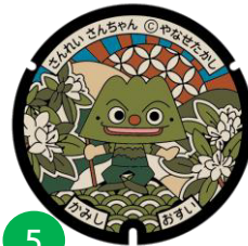
さんれい さんちゃん

香美市を流れる「物部川」と物部川の「鮎」がモチーフ。物部川に住んでいる鮎の妖精。物部川を泳いでいるなどところへ行く。その際情報を沢山仕入れるようで、なかまたちの中で一番の情報通。