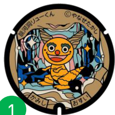
龍河洞リューくん ※マンホールカードあり