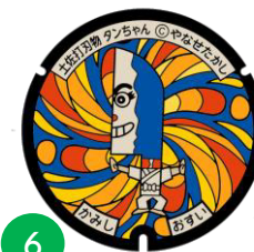
土佐打刃物 タンちゃん

香美市物部町の登山者に人気のある西日本を代表する山「三嶺」がモチーフ。登山家。どしりとしてちょっとのことでは動けない。アウトドアに長けており、みんな、さんちゃんのことを頼りにしている。