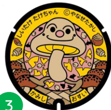
しいたけ たけちゃん

生産高日本一を誇る香美市物部町の特産品「ゆず」がモチーフ。愛嬌があり、しっかりしている。まだ幼く、融通がきかず、言い出したらゆずらないところがある。お風呂が大好きで、みんなにもゆず湯をすすめている。