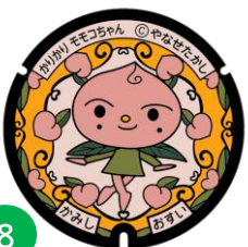
かりかり モモちゃん

香美市物部町の特産品であるイチヨウの実「ぎんなん」がモチーフ。弾けるような、元気いっぱい性格。なんにでも興味を持つので、しいたけたけちゃんと一緒にいろいろなものを見てまわっている。