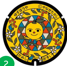
ゆずぼうや ※マンホールカードあり

国の天然記念物及び史跡である香美市土佐山田町の鍾乳洞「龍河洞」がモチーフ。冒険が大好きで龍河洞の中のことは全て知っている。体温は龍河洞の洞内と同じ約16℃。夏はひんやり冬はあったか。