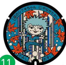
瀧のシブキちゃん

梅雨の頃に可憐に咲き乱れる香美市香北町の「あじさいロード」をモチーフにしてデザインしています。お酒が大好きでとても強い。その色気にみんなメロメロ。