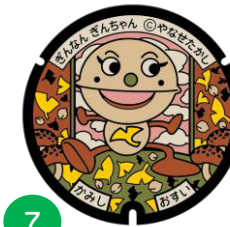
ぎんなん ぎんちゃん

400年の歴史を誇る香美市土佐山田町の地場産業「鍛造」及び伝統工芸品「土佐打刃物」がモチーフ。正義を貫くまっすぐな武道家。曲がったことが大嫌い。頭がキレる。動きにもキレがある。少しおこりっぽいのが玉にキズ。