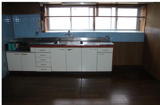
ダイニング・キッチン