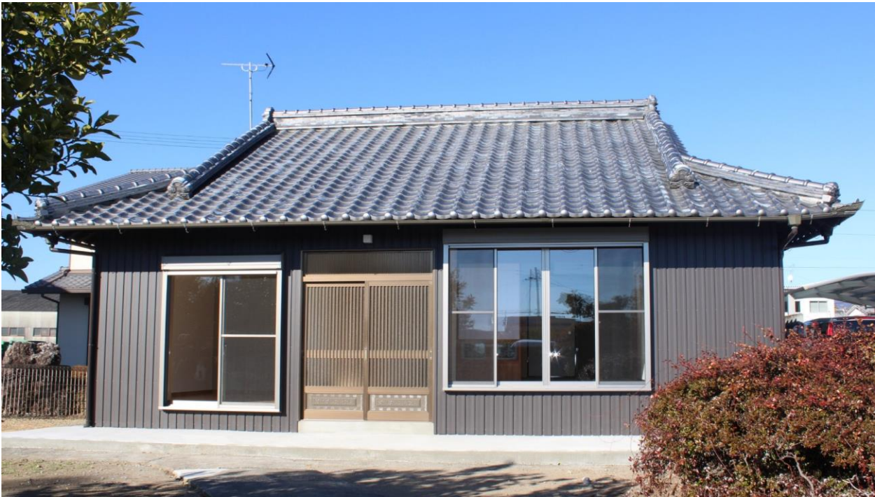
土佐山田町の市街地にある、日当たりの良いコンパクトな平屋。 2025年に全面的な耐震補強・リフォーム工事を実施。