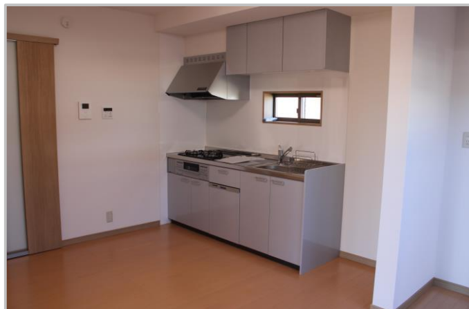
ダイニングキッチン