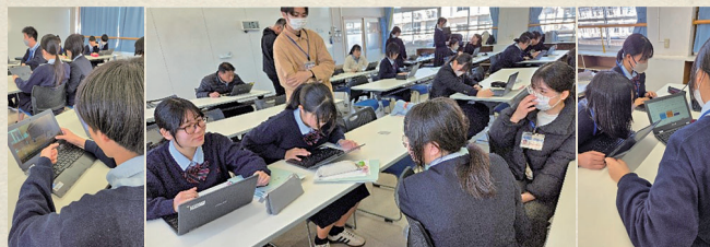
▲まとめの活動に向けて、情報を整理するG探1・2年生の様子

3学期に入り、探究活動も「まとめ」の時期となりました。これまで行ってきた探究活動を総括し、わかったこと・言えること、今後の展望などを自分たちの言葉でまとめていく時期です。「まとめをする」と口で言うのは簡単ですが、実際にはなかなか難しいものです。今まで行っていた「探究活動」をサッカーの試合に例えると、生徒たちはプレイヤーとして、フィールドで試行錯誤しながら経験を積んでいました。ゴールを決めるために「どこに蹴る？蹴り方は？守備はどうする？」など、その都度判断し、走り回りました。それに対し「まとめの活動」は、その試合を改めて上空のカメラで振り返るような作業だと言えます（いつ、だれが、どんな戦略を持ってどこに蹴り、結果はどうだったか？）。探究の話に戻すと、これまで行なった活動で何が分かっ