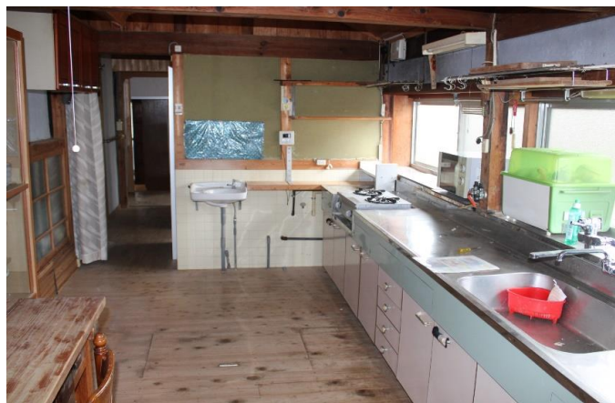
ダイニング・キッチン