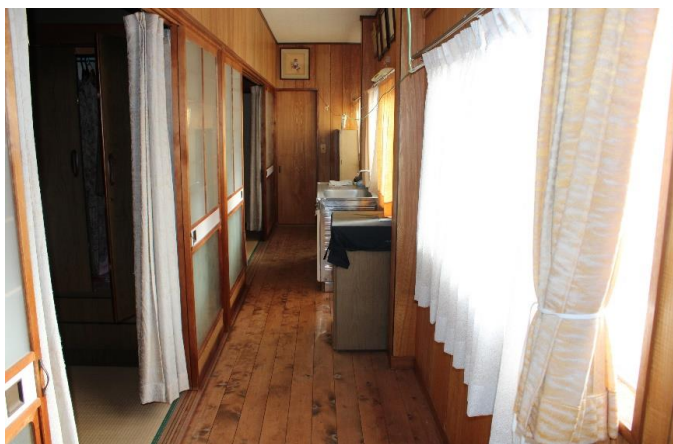
離れ_廊下(キッチン台設置)