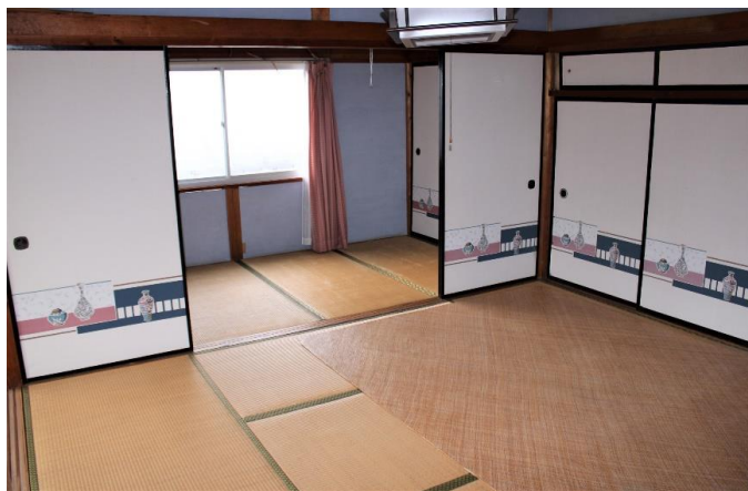
＜納屋2F＞ 和室 4畳・6畳