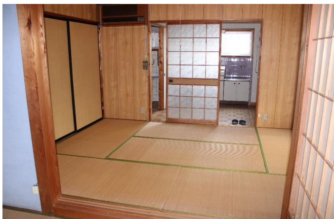
＜納屋2F＞ 和室 6畳