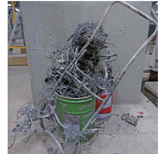
▲焼却灰排出口に詰まった 金属ごみ