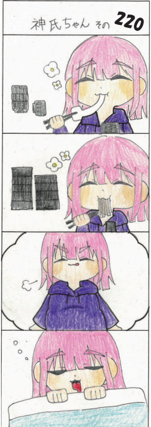
(山田高校マンガ部)

可燃ごみへの金属ごみ等 の混入が増えています。可 燃ごみは、香南清掃組合で 焼却処理を行っていますが、 金属ごみの混入により、焼 却炉内に燃え残った金属が 詰まり、場合によっては機 械等の破損や故障につなが ります。この場合、修繕の ため、ごみの処理に大きな 支障が出ることとなります。 このような状況を防ぎ、 スムーズなごみの焼却処理 を行うため、正しいごみの 分別をお願いします。