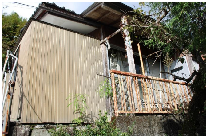
隠居小屋 外観 ②