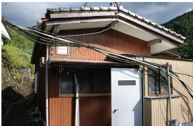
隠居小屋 外観 ①