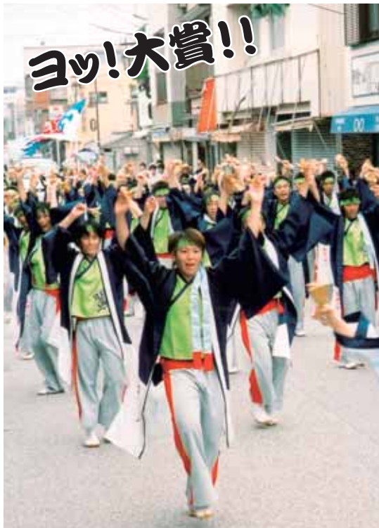
12年連続で“土佐山田まつり大賞”を受賞した高知工科大学チーム