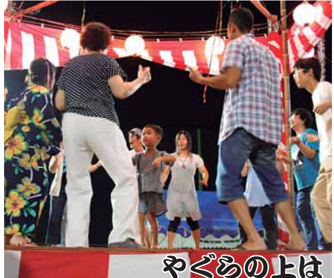
やぐらの上は 気持ちいい~

祭りの会場中心に設置されたやぐらを囲んで踊り子たちが踊り出し、帰省客らも流れつづける音楽にさそわれて踊りの輪に加わると、いつしか会場全体が盛り上がるステージになりました。