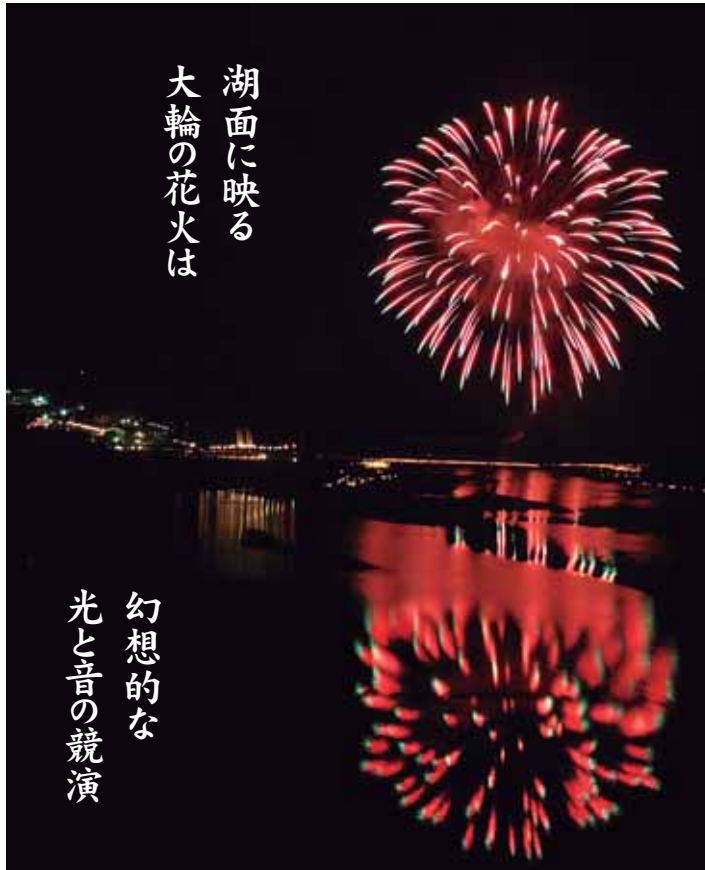
湖面に映る 大輪の花火は