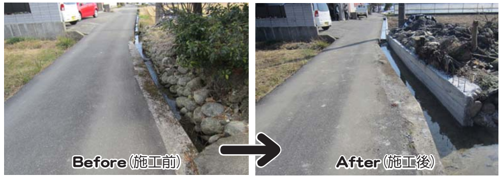
岩積自治会（土佐山田町岩積）では、農業用排水路整備工事（全体費用190,125円）に、香美市地域活性化総合補助金（農地・農道・水路整備事業）を活用しました。