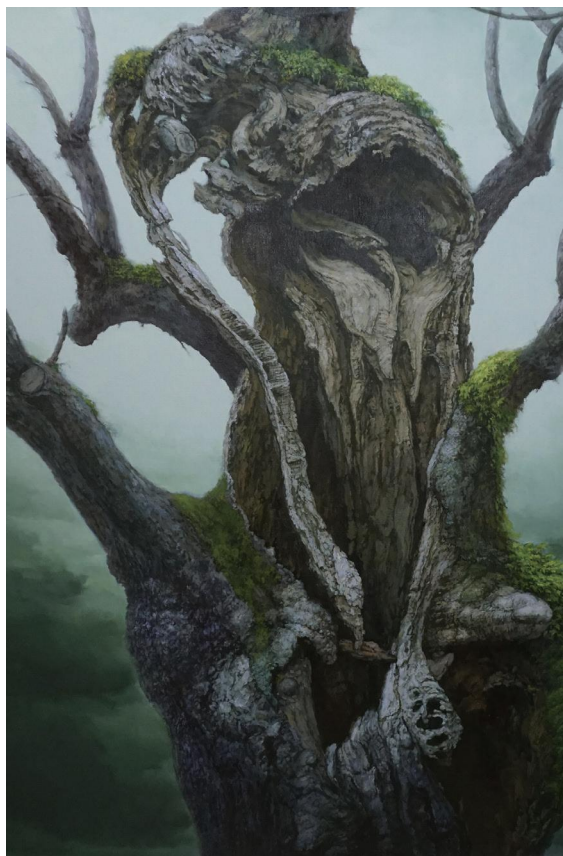
朽ちゆく時間(武雄の大楠) 2024年