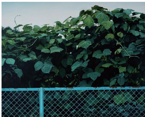
物語のない風景 1988年 高知医療センター蔵