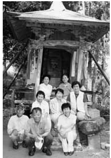
実行委員の世話人らと大師堂の前で撮影(前列右が依光さん)