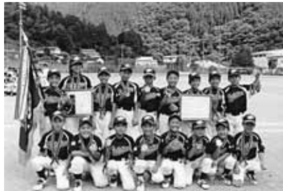
香長ファイティングのメンバー

今年1月末に結成したばかりで、バット1本、ボール1個すらない状態からスタートしました。保護者や関係者の支援により道具をそろえ、選手自らグラウンドの石拾いをしながら厳しい練習に耐え、結成半年で準優勝という栄誉を勝ち取った喜びは、何事にも代え難い大きな宝となりました。（香長ファイティング）