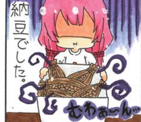
(山田高校マンガ部)