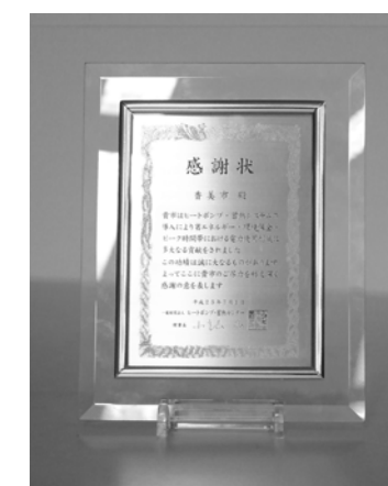
▲香美市に贈呈された感謝状

※割安な夜間電力を利用して夏は氷、冬は温水を作り、昼間エアコンに利用する氷蓄熱式空調システム