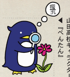
山田高校キャラクター『ペンたん』