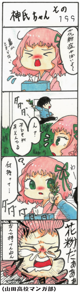
(山田高校マンガ部)

◆ 募集写真 県内外・室内外を問わず、フrafが写っているもの。1人1点で、未発表の作品に限る。※個人のSNSなどに掲載した写真は可