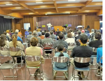
▲ 昨年11月に開催された演奏会のようす

◆ 第6回フrafのある風景フォトコンテスト 令和6年4月1日～5月31日に撮影されたフrafの写真を募集します。また、応募いただいた先着100名に、カミカポイント500ポイント付与します。 ◆ 各賞 1作品 ◆ 協賛団体賞 数作品 ◆ 次世代賞 数作品 ◆ 応募先メールアドレス matidukuri@city.kamii.jp ◆ 問い合わせ先 香美市ものづくり会議事務局 (定住推進課内) ☎53-1061