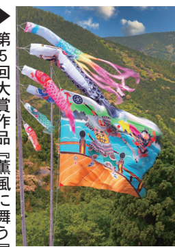
▶ 第5回大賞作品『薫風に舞う』