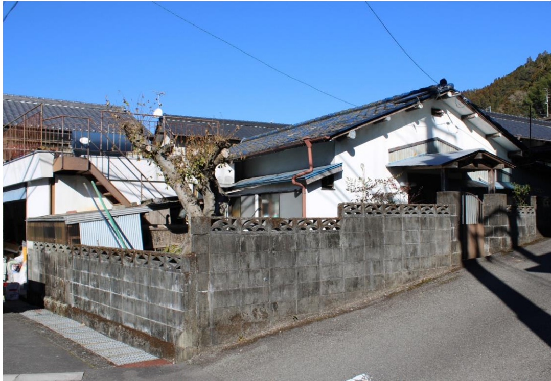
小学校・中学校も近く、広い車庫（倉庫）のある平屋物件。 車庫の上は見晴らしの良いバルコニーになっています。