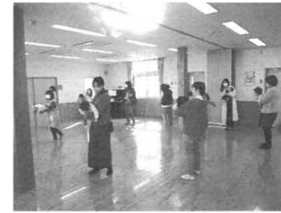
親子ふれあいリズム