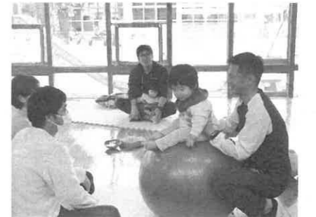
みんなで体操したよ