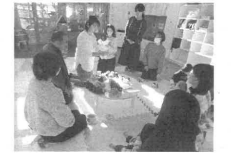
子育て講座「靴のおはなし」