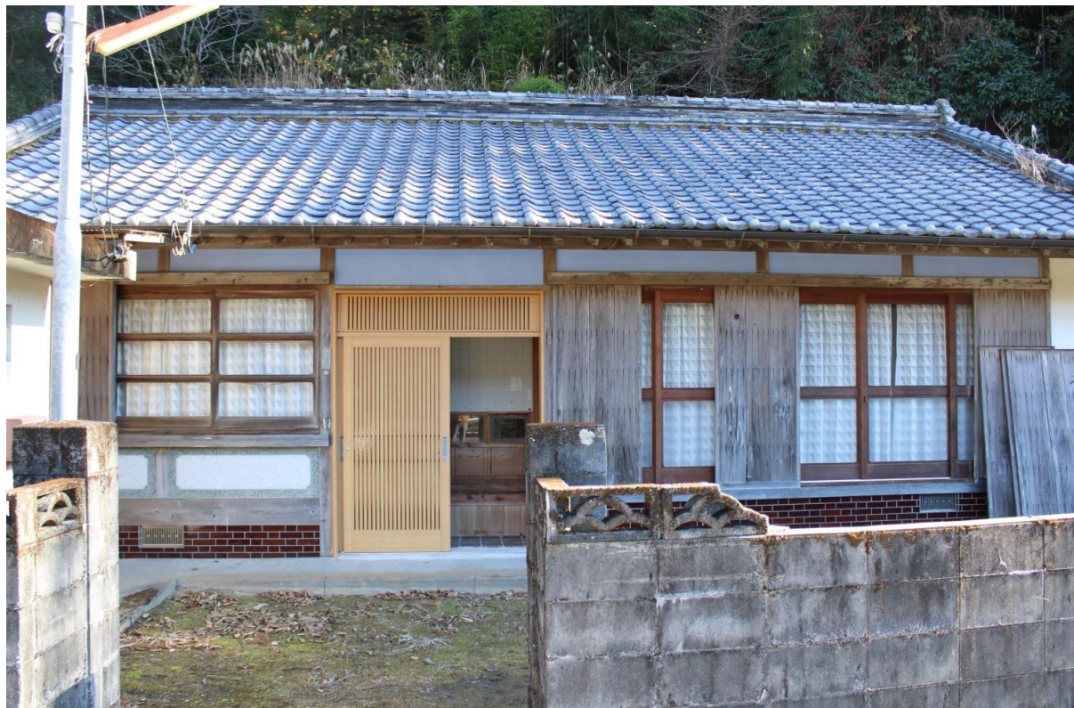
奥物部の県道に面する平屋一軒家。道向かいに、約140坪の畑があります。