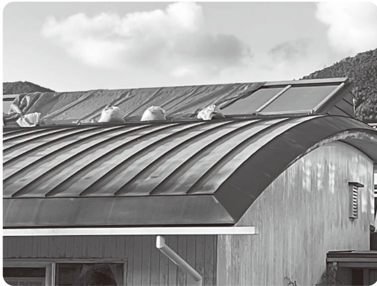
子育てセンターびらぶ

A 最終的な原因は屋 根をはがしてみないと 分からないことから、 雨漏りのある南側の屋