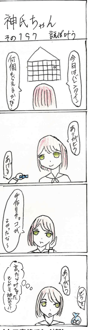
(山田高校マンガ部)