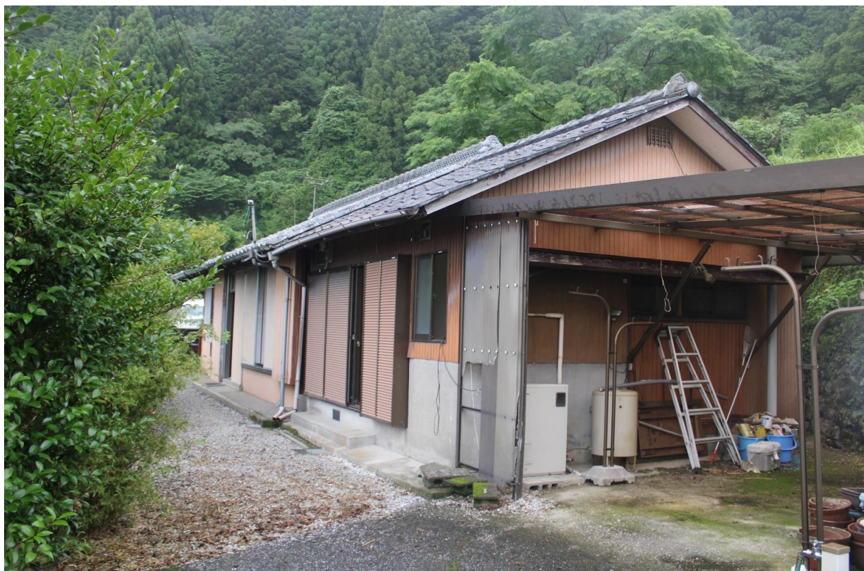
山の上で日当たりもよく眺望がすばらしい平屋民家。 敷地つづきの菜園の他、小さな畑（約10坪）もついています。