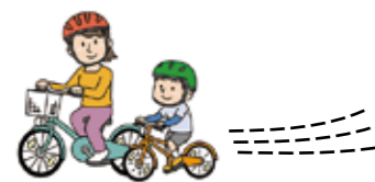
自転車関連事故件数の推移

また、全交通事故に占める自転車関連事故の構成比は、平成28年以降増加傾向にあります。